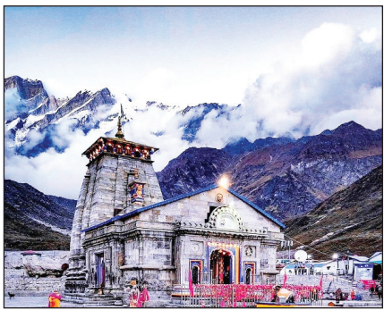
उत्तराखण्ड में चारधाम यात्रा की उल्टी गिनती शुरू हो गई है। केदारनाथ धाम के लिए श्रद्धालुओं में जबरदस्त क्रेज देखा जा रहा।